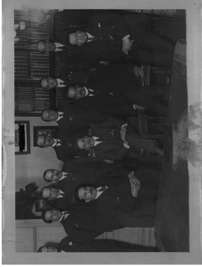
Fotografía del acto de transmisión del Decanato de la Facultad de Filosofía y Letras de Ricardo Rojas a Coriolano Alberini, octubre de 1924. Rojas aparece señalado con el número 3 y Alberini con el número 1.

Fuente: Archivo General de la Nación, Argentina.